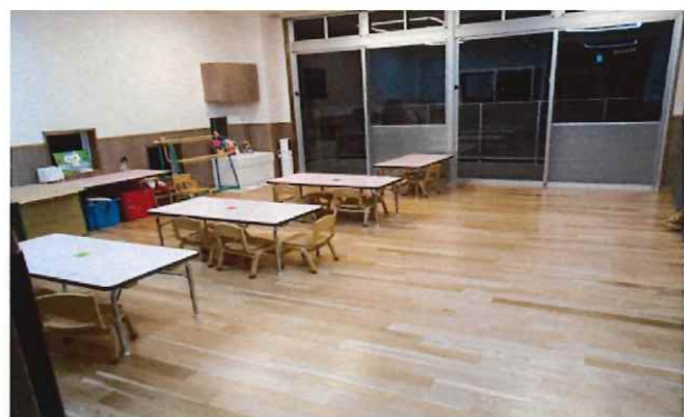
3歳児室 ペンギン組