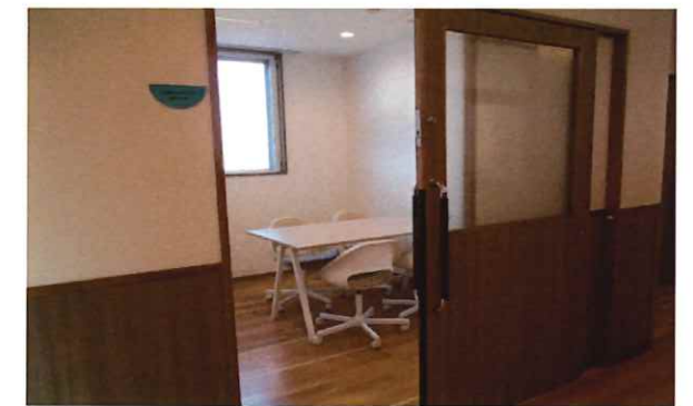
カンファレンスルーム