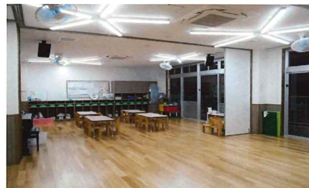
5歳児 きりん組 ホール